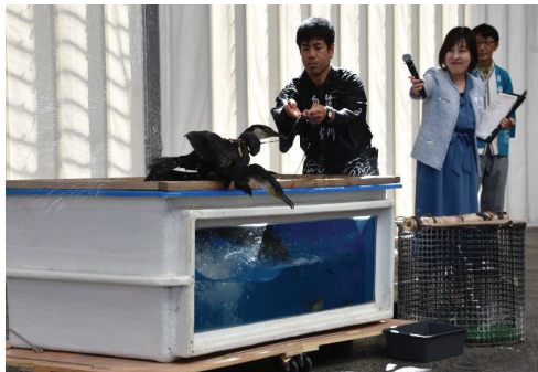
原鶴温泉鵜飼ショー